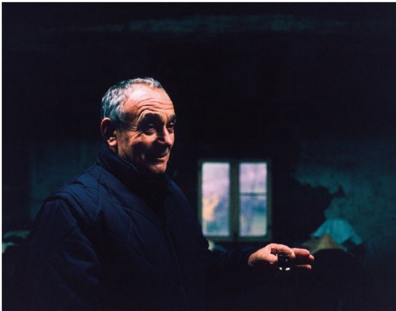
Aceto Balsamico World Champion