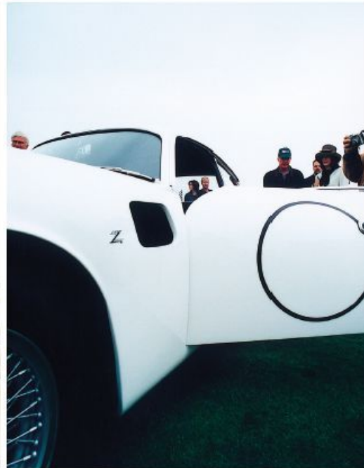
Pebble Beach Car Show