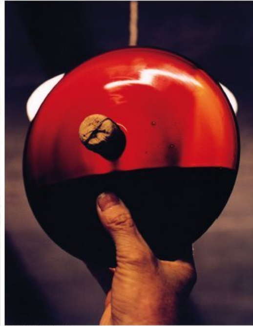
Aceto Balsamico Tradizionale